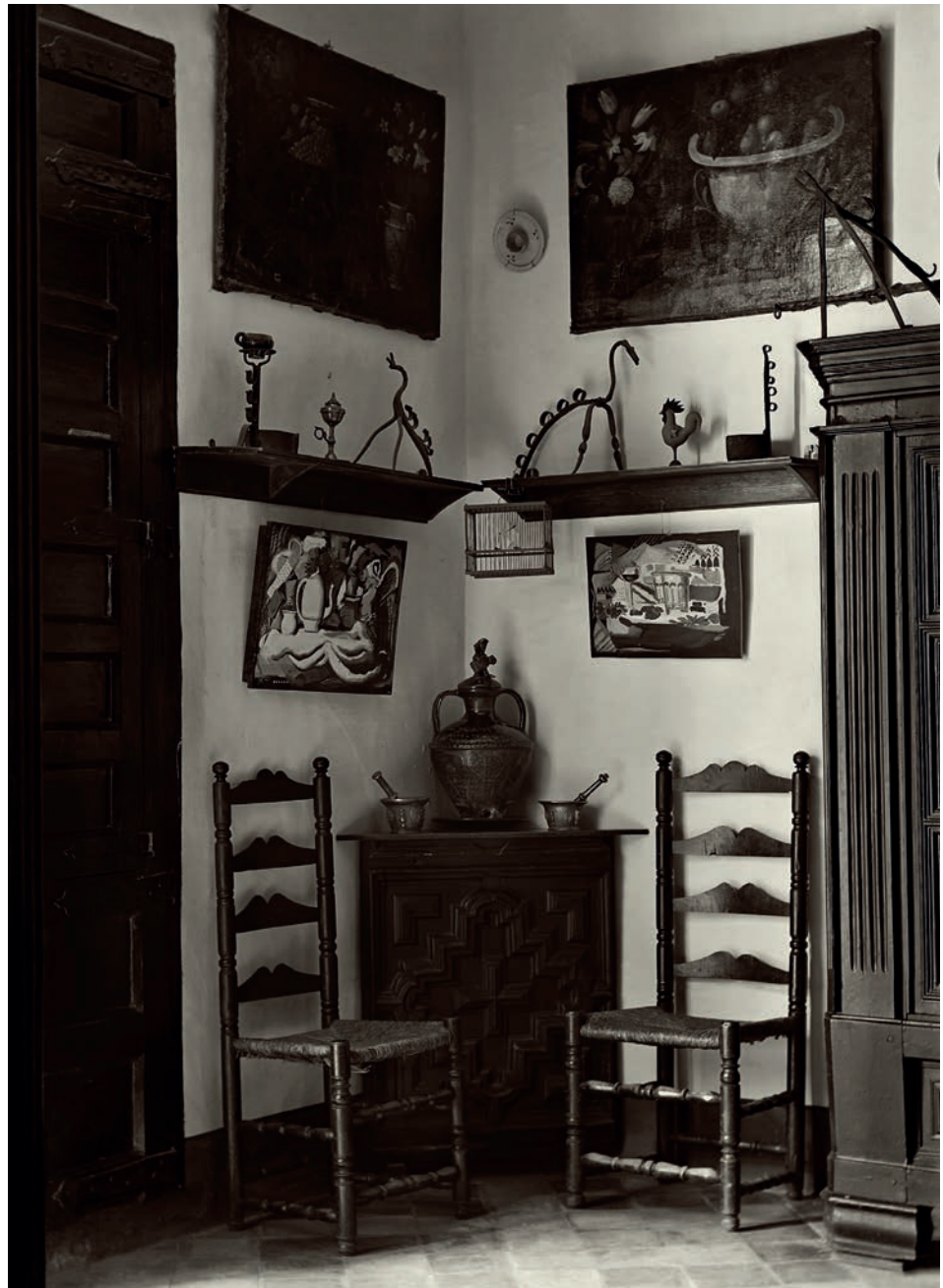
Ricardo Compañé Un rincón comedor. Huesca, c. 1928