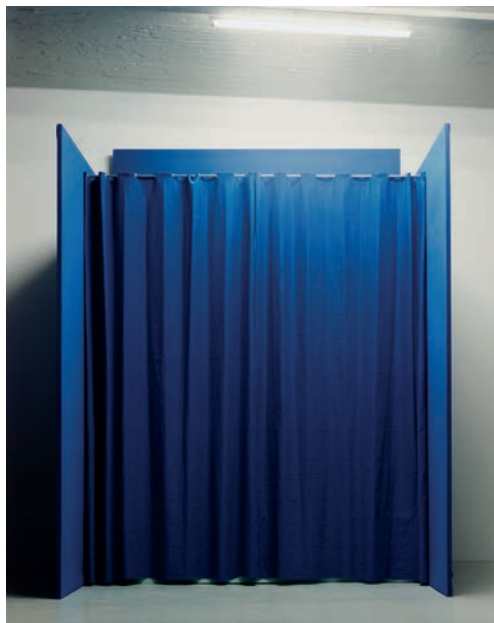
© José Noguero, VEGAP, Huesca, 2024