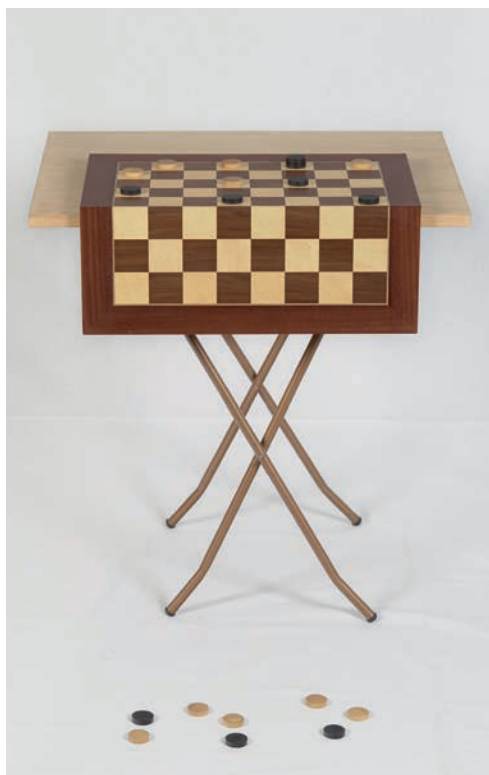
© Fundació Joan Brossa, VEGAP, Huesca, 2024