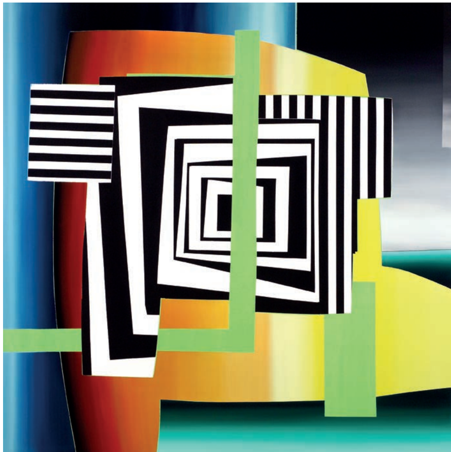
© Enrique Larroy, VEGAP, Huesca, 2024