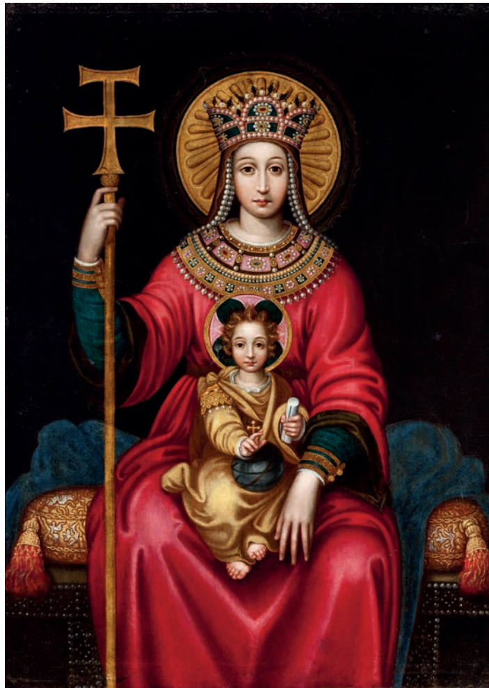
Antonio Lachos Roldán Piedras en el tiempo, 2014