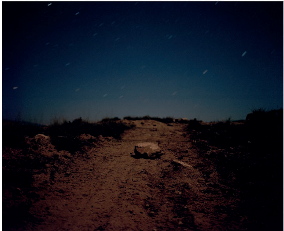
© Bleda y Rosa, VEGAP, Huesca, 2024