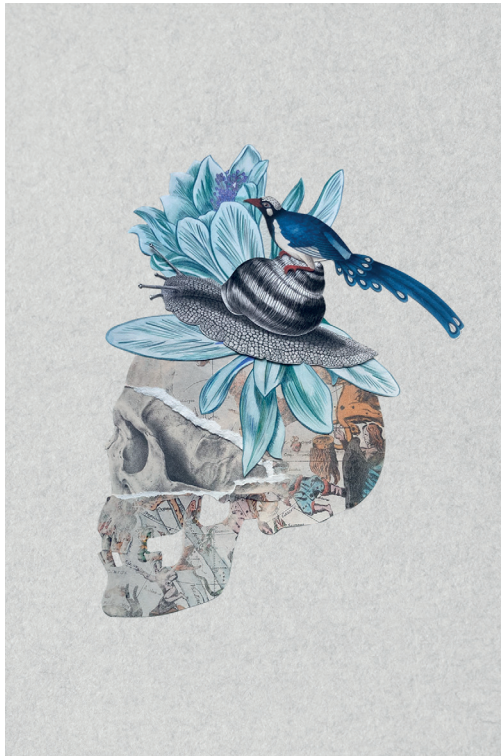
Sallage "Mapa de vida" Collage sobre papel, 50 x 50 cm. 2024.