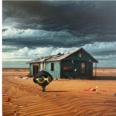
Gallery Afternoon (Seúl) Beomju Ko, Just leave it