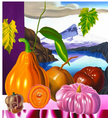
Galería Yusto/Giner (Madrid/Marbella) Remus Grecu, Still Life 2