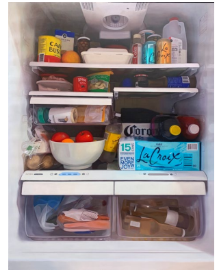
Espacio Líquido/La Gran (Madrid/Valladolid) Andrew Leventis. Home Refrigerator