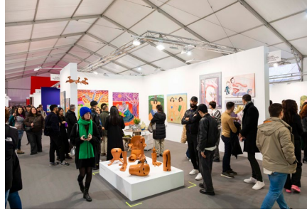
UVNT Art Fair 2024