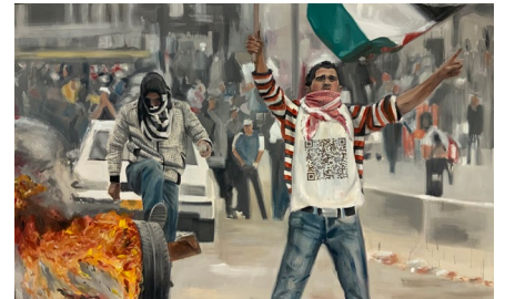
Gabinete de Dibujos (Valencia) ESCIF, Peace Off