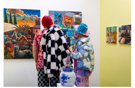
UVNT Art Fair 2024