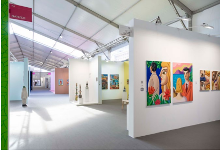
UVNT Art Fair 2024

Matadero Madrid Plaza de Legazpi, 8 uvnt-artfair.com