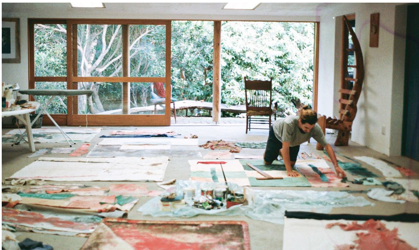
Documentación fotográfica - MUDA, por Carlos Herraiz